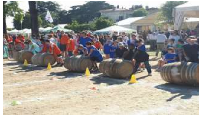
Der groß Garten Secco d'Aragona