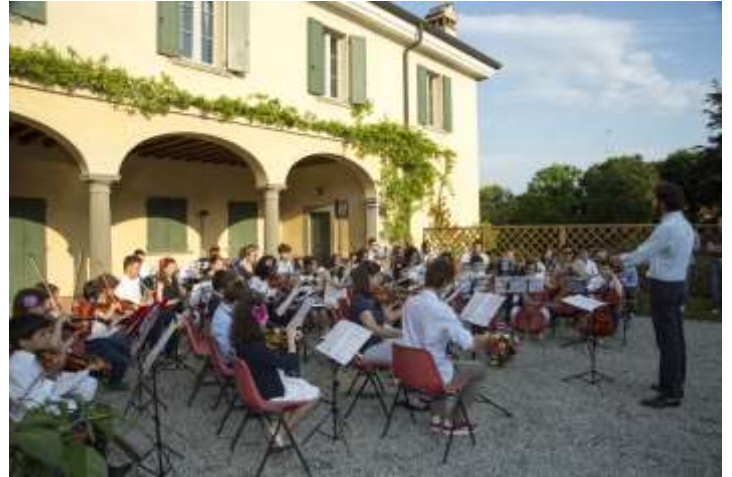
Villa La Rocca – 13 – 18. Jh.