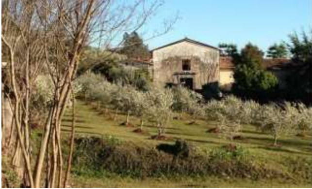
Antica Pieve San Bartolomeo – 10. Jh.