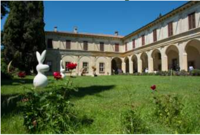
Palazzo Secco d’Aragona – 16. Jh.