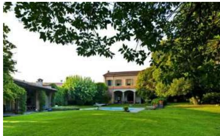
Villa Fanti – siglo XVIII - Sistershouse.it