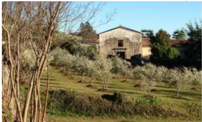
Antica Pieve San Bartolomeo – siglo X