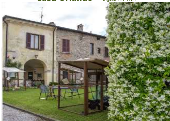
Casa Orlando – siglos XV-XIX