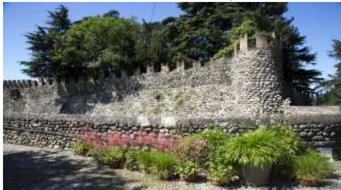
Castello Orlando – siglos XIII-XVI