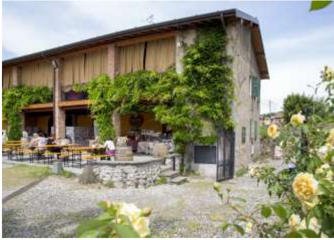
Cantina Biondelli – siglo XVI