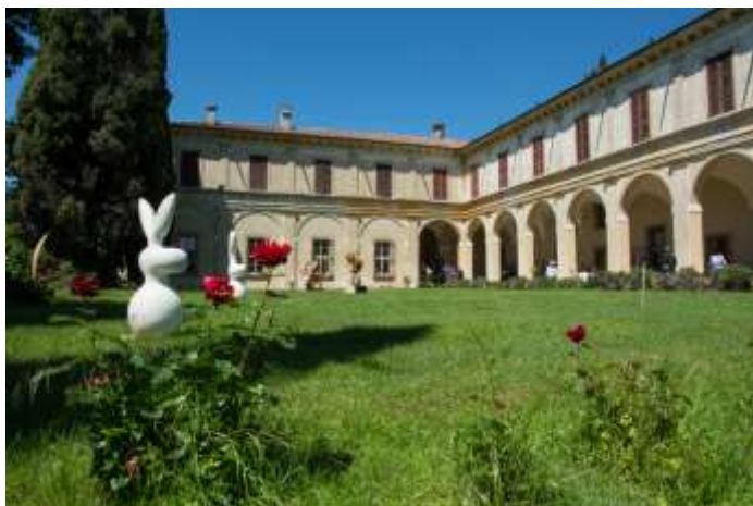
Palazzo Secco d'Aragona – siglo XVI