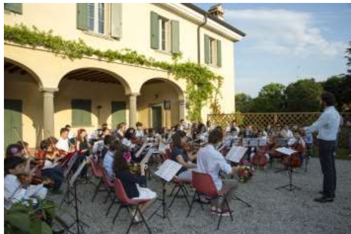
Villa La Rocca – siglos XIII-XVIII