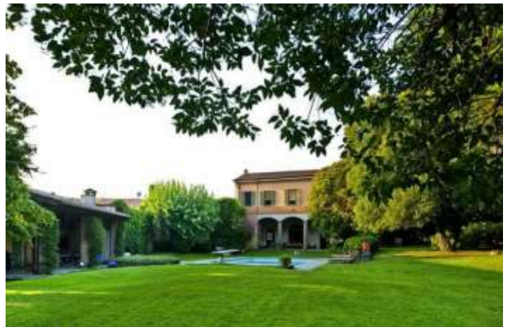
Fanti 别墅 – sisterhouse.it